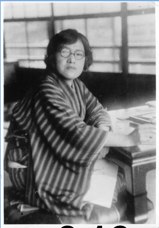
与謝野晶子近影 昭和五年五月 天橋立にて