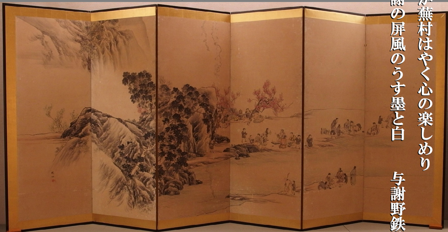
松川龍椿「蘭亭曲水図」(左隻)